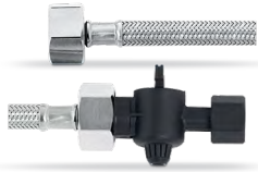
Manguera de admisión DN 8 3/8" - 3/8" válvula de cierre