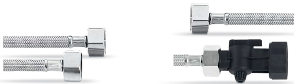
Set de mangueras I