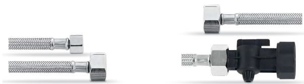
Set de mangueras II