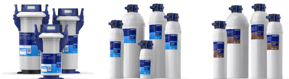
PURITY QUELL ST PURITY C QUELL ST PURITY C FINEST

A continuación le presentamos un resumen de la gama de productos de filtrado PURITY, diseñados específicamente para usarse en máquinas de vending. BRITA Professional cuenta con la solución adecuada para usted y ofrece la mejor agua, sin importar la composición del suministro principal.